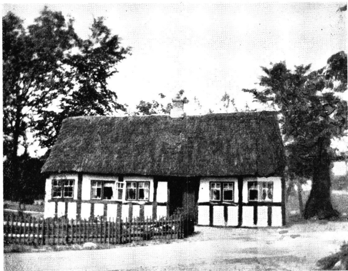
Den ældste Skole i Mesing.

1761 var der 10 Gaarde i Mesing, deriblandt en An-