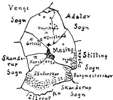
Kort over Mesing Sogn.

Anneks til Adslev, omgives af dette, Venge og Skanderup Sogne, Skanderborg Købstadjorder og Stilling Sogn, fra hvilket sidste det skilles ved den smalle,