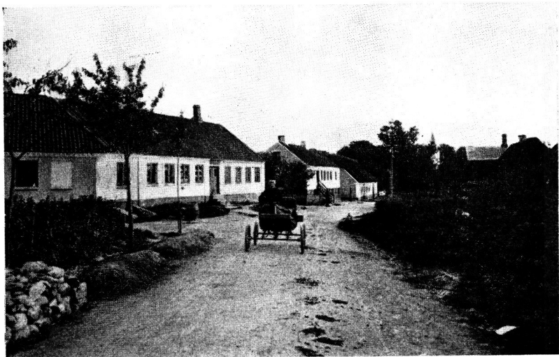
Borum Bygade 1906.

Hasle, et Stykke Side om Side med den gamle Ryvej. Over Mundelstrups lerede Jorder kunde man ved Midten af forrige Århundrede jævnsides med den nyanlagte Chaussé endnu se ikke alene den aflagte, indgrøftede Landevej, men også talrige ældre Færdselsstriber over Markerne. Hjulspor ved Hjulspor, så slidte og dybe, at Vognakselen måtte slæbe på Rygningen i deres Midte og Bønderne køre i samlet Vognrække i samme alendytte Furer, hvor det var totalt umuligt at vige til Side. Medens Chausséen i 1850 strakte sig i lige Linje frem over Lading, tog dens Forgænger sig rundelig Tid til en Afstikker over Vejkrydset ved Borum, der tidligt må have fået Betydning som Knudepunkt i en eller anden Henseende. Der må jo have været særlige Grunde for, at Viborgvejen fra Arilds Tid netop gik gennem denne Landsby, ad hvis nordre Bygade den gamle Vej krogede sig Nord forbi Kroen, hvor den stødte til Skanderborg-Randers Landevej. De talrige omiggende Kæmpehøje tyder på stærk Bebyggelse i Oldtiden, og det er meget sandsynligt, at Kroholdet her er af meget gammel Oprindelse. Det daterer sig vistnok fra 1587. Borum som Vejsamlingssted var måske også Årsag i, at gennem en længere Tidsperiode (o.1535—o. 1667) boede Herredsfogeden her 20 ), og dette har vel været Grunden til, at alle unge Karle fra Stiftet før Fredsbruddet i 1657 fik Befaling til at møde i Borum. Der skulde af de fremmødte udtages et vakkert Mand-