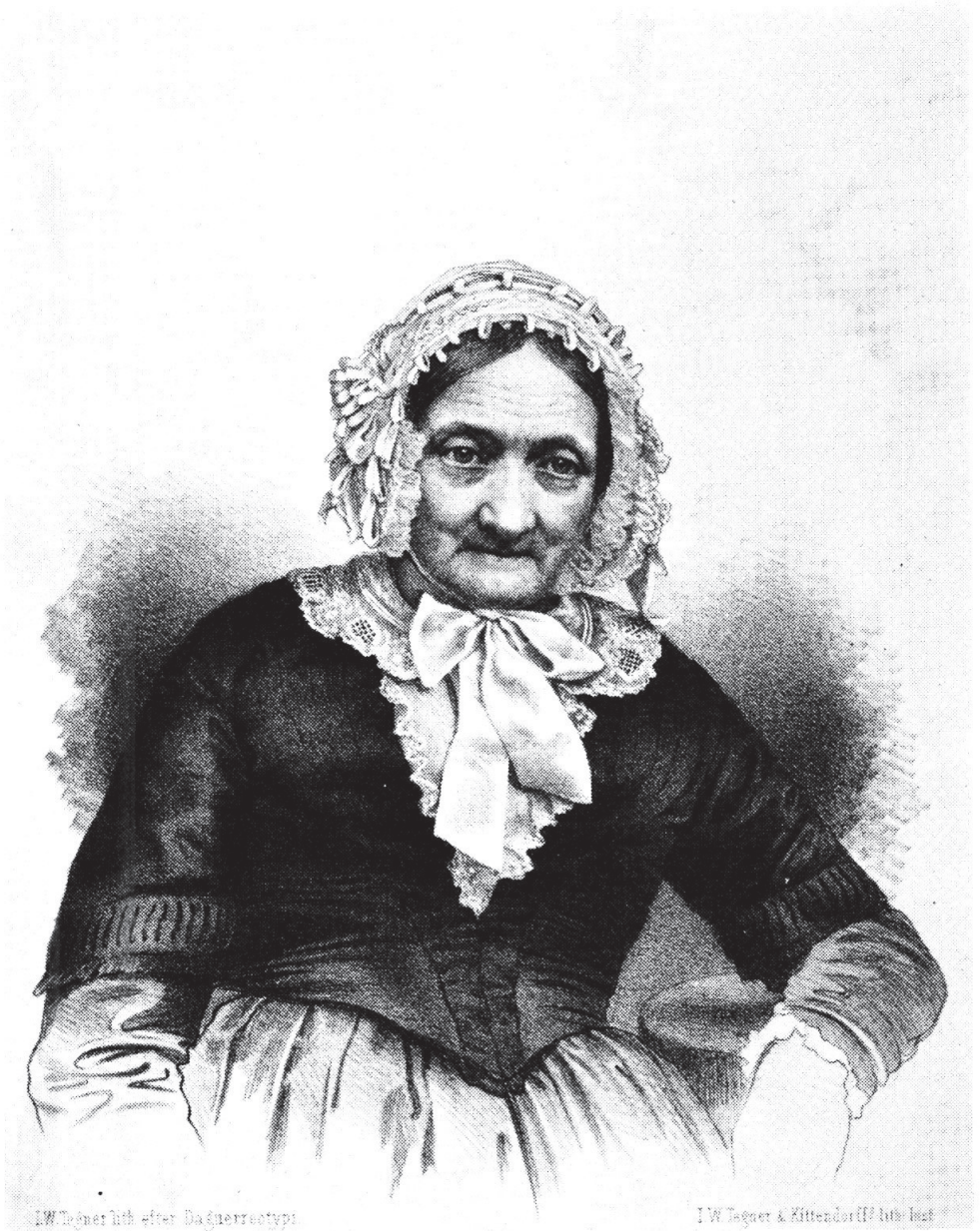
L.W. Tegner lith. efter Daguerrestypt.