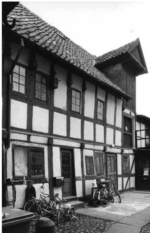
Klostergade 58, gårdparti. Foto 1984 på Stadsarkitektens kontor.

I brandtaksationsprotokollen er de to naboejendomme dels beskrevet samlet, men der er også tilføjet en adskilt beskrivelse, da den nye ejer havde foretaget væsentlige forbedringer og derfor havde ønsket en ny vurdering af hensyn til brandforsikringssummen. I denne tilføjede beskrivelse er Klostergade 58 beskrevet bl.a. med 9 fag forhus, 6 fag sidehus (begge i 2 etager) og 7 fag baghus. 18 På dette tidspunkt begyndte man