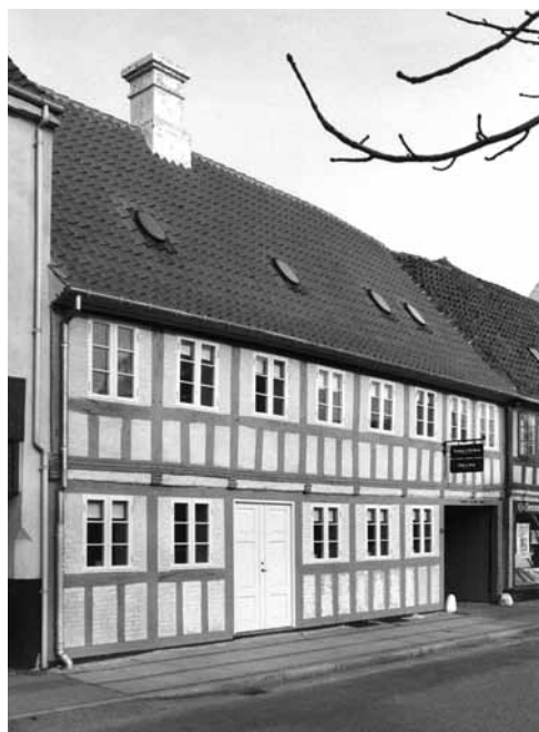
Klostergade 60, facade. Foto 1984 på Stadsarkitektens kontor.

Også han har ved siden af sin købmandshandel drevet rederivirksomhed.