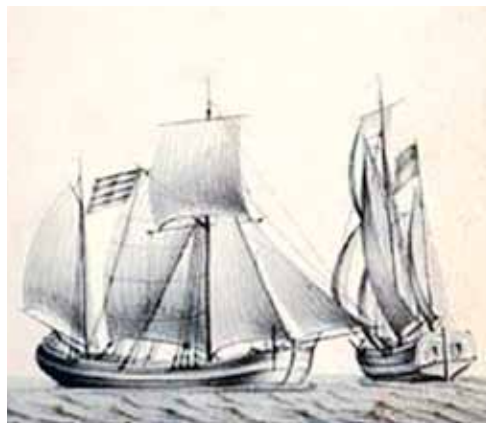
Til venstre på billedet en galeot/galliot, der er rundgattet (runt agterparti). Til højre på billedet en galease, der er spejlgattet (fladt agterparti). Efter billede i Handels- og Søfartsmuseet i Helsingør.