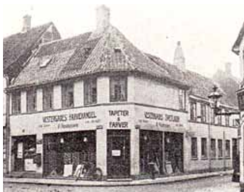
Hjørneejendommen Vestergade 42/Grønnegade 37.