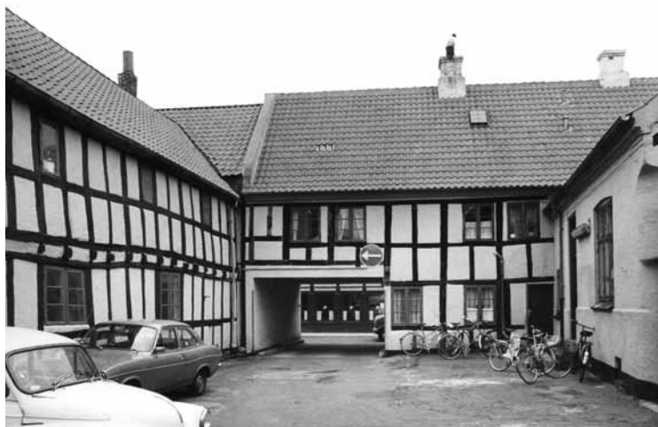
Vestergade 47, gården. Bygningerne menes opført omkring 1600. Foto 1984 på Stadsarkitektens kontor.