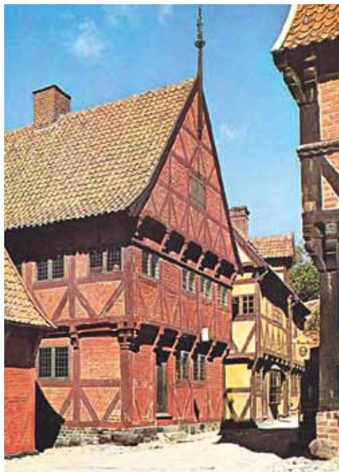
Hjørneejendommen Mejlgade/Havgyden, som den i dag står i Den gamle By, hvor den er søgt tilbageført til dens oprindelige renaissanceudseende.

genheden fastlægges til Vestergades vestre side – altså den del af daværende Vestergade, der i dag benævnes Vesterport, og nærmere bestemt til den nuværende matr. nr. 495, der angiver, at beliggenheden har været midt på nuværende Vesterports vestre side.